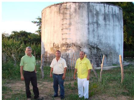
Alvorada do Gurguéia

Obras promovidas pelo CORESA Sul do PI têm como objetivo a solução para a crise