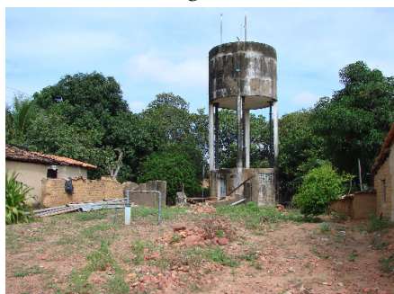
Palmeira do Piauí