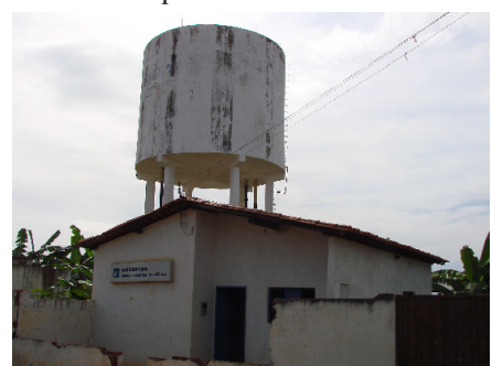
Redenção do Gurguéia